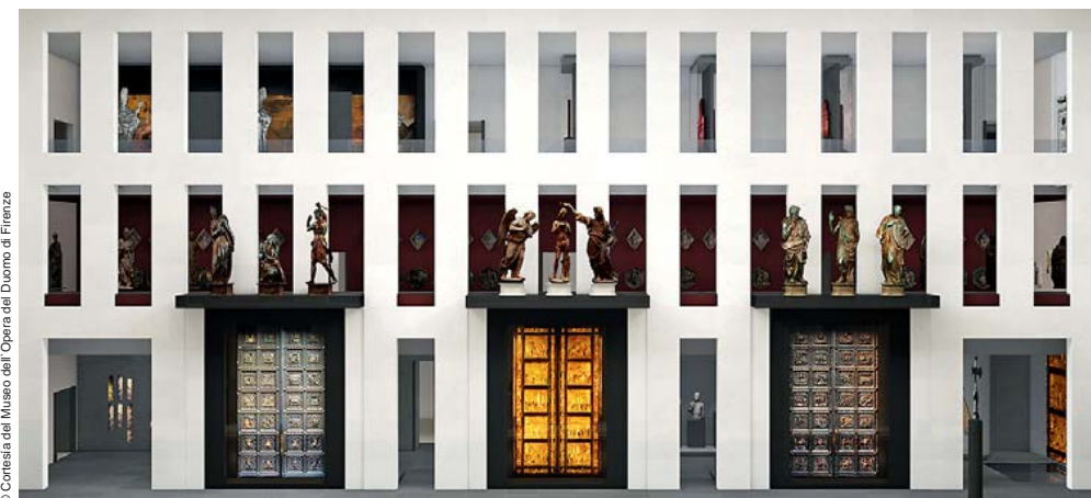
Natalini Architeti, Guicciardini e Magni Architeti, Museo dell'Opera del Duomo (Florencia), vista de las puertas y estatuas originales del Baptisterio

The architecture and museum design of the Foundling Hospital is by a group of architects called Ipostudio, which won an international competition organized for the purpose in 2008, and has managed to create a museum that presents both a social history and a history of ar-