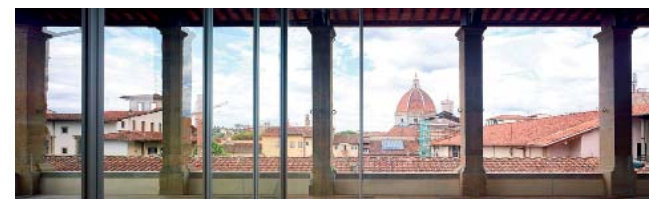
Nuevo Museo de los Inocentes, Café Verone Nuovo Museo degli Innocenti, The Verone Café

On the third floor we find the main exhibition hall, the art gallery,