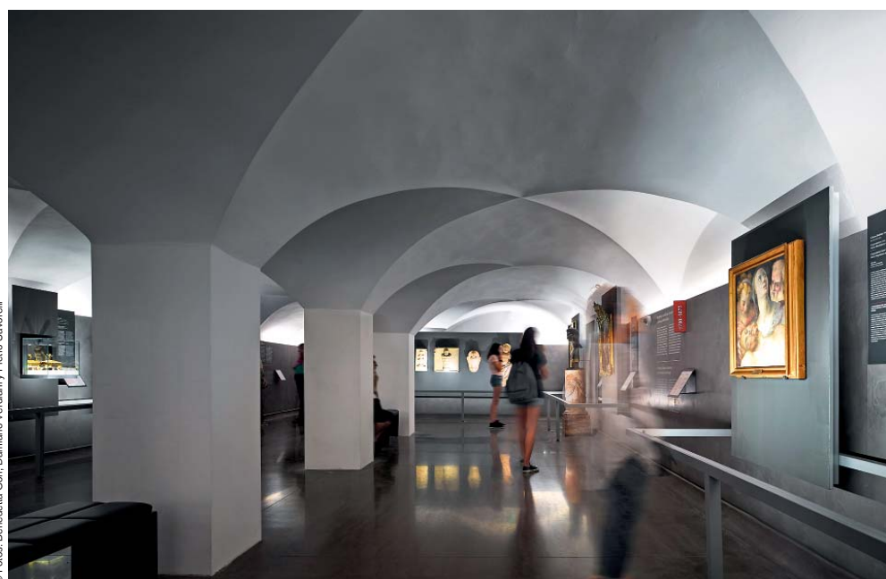
Nuevo Museo de los Inocentes, Nuevo acceso Nuovo Museo degli Innocenti, New access