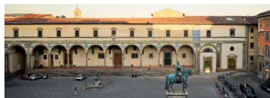
Ipostudio, Nuevo Museo de los Inocentes (Firencia) Nuovo Museo degli Innocenti (Firencia)

El recorrido por el edificio construido por Brunelleschi en 1445 comienza en la sala abovedada del sótano y termina en el ático con vistas sobre la cúpula, tras atravesar la pinacoteca situada bajo cubierta.