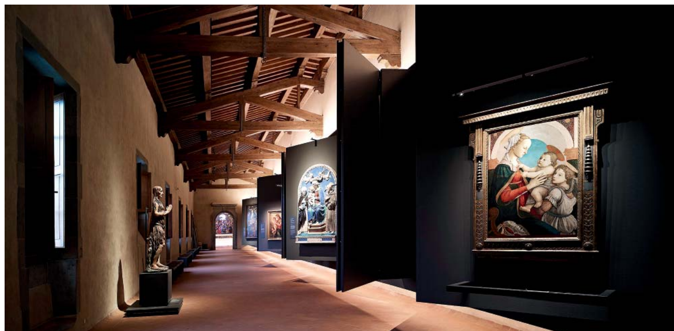
Nuevo Museo de los Inocentes, Pinacoteca Nuovo Museo degli Innocenti, Gallery