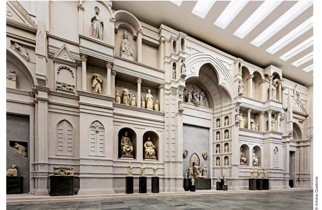
Reconstrucción a escala real de la primera fachada de Santa María del Fiore

The museological project is centered on architecture from the very beginning, starting with Arnolfo di Cambio and passing through Filippo